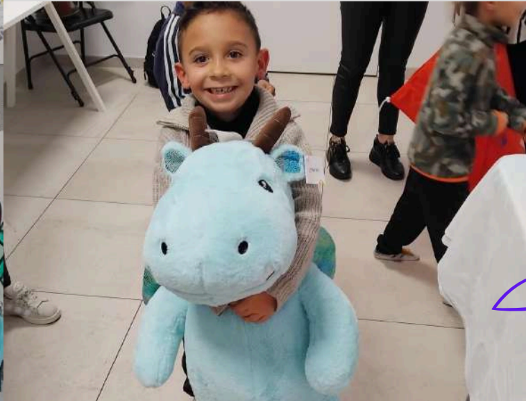
Notre grand gagnant de la tombola de décembre 2026